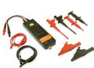
T3HVD1500-200 高電圧差動プローブ

*ソフトウェアはオプションカードにて納品されます。実装には登録手続きが必要となります。