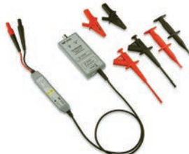
T3LVD20-200 低電圧差動プローブ