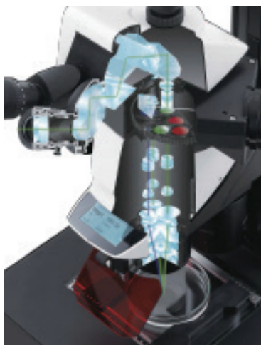
Triple Beam 蛍光光路 (M205FAの例)

1台で広範囲の観察対象をカバーすることができる高性能な蛍光実体顕微鏡。世界に誇るライカクオリティの光学系を搭載し、どのズーム倍率でも視野全体を均一な明るさで照明します。ライカ独自のTriple Beam 技術は、蛍光照明専用開発された第3の光路を持ち、結像をさまたげる散乱反射の発生を無くすことで、明るいシグナルと抜けの良いバックグラウンドでハイコントラストな観察を可能にします。