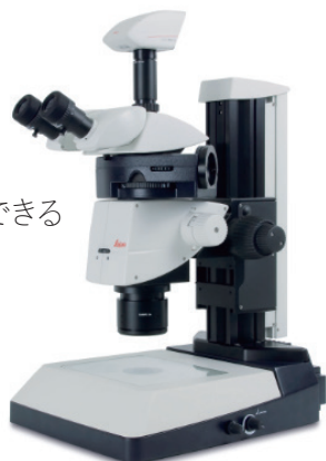
M165 FC ※構成は仕様により異なります。