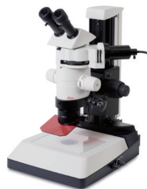
MZ10 F ※構成は仕様により異なります。