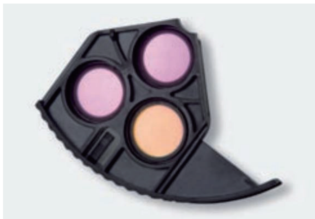
蛍光フィルターセット